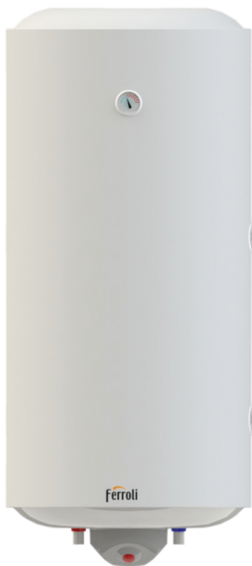
CALYPSO 200 VMT