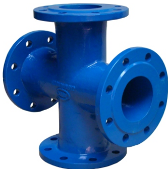
Cruce cu flanse tip CF