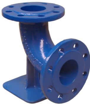
Cot cu picior N